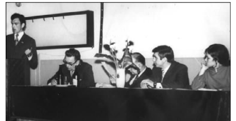
Секційне засідання XVII студентської конференції

1973-1974 навчальний рік став етапним для СНТ. Кількість гуртківців зросла з 32 до 38, а число гуртківців – з 414 до 800. Була організована перша студентська науково-дослід-