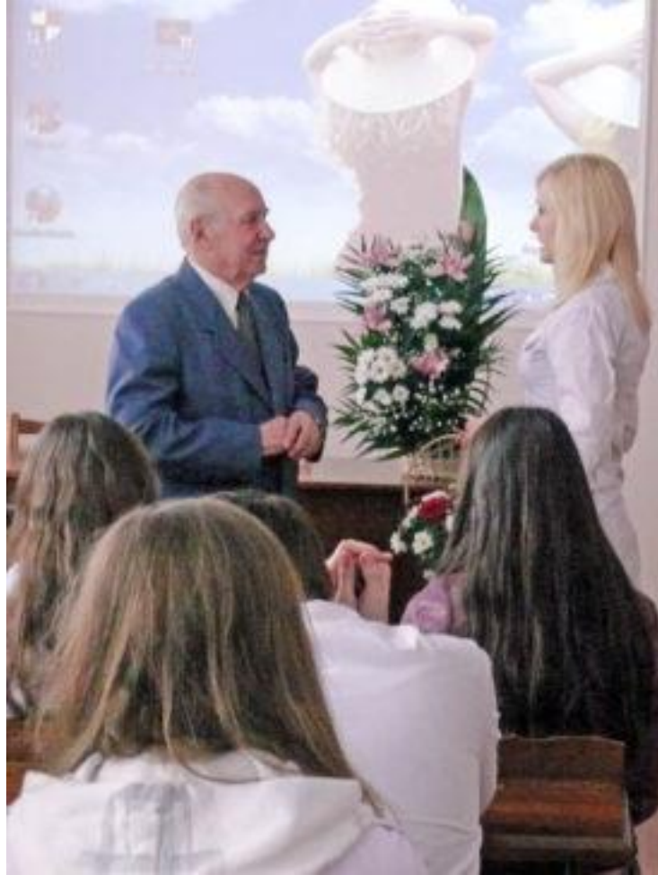
Зустріч зі студентами ТНМУ (березень 2012 року)