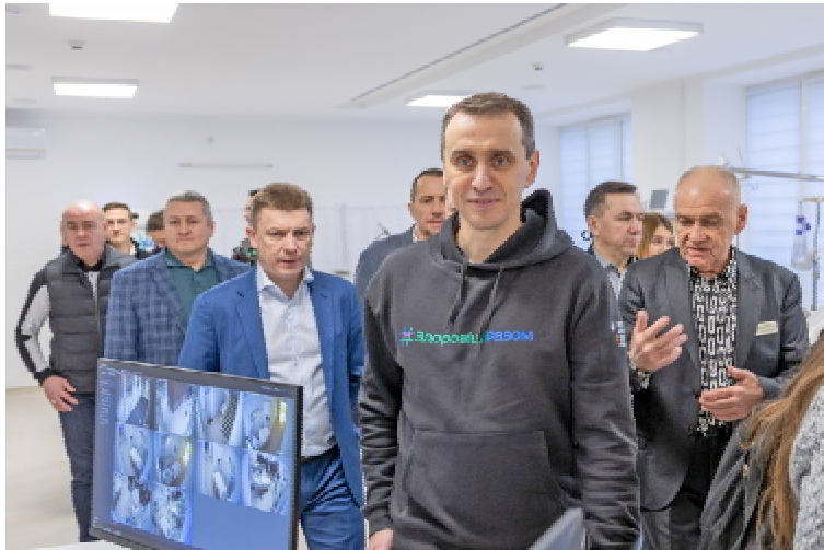
Міністр охорони здоров'я України Віктор ЛЯШКО (на передньому плані) під час відкриття відділення інтенсивної терапії й кризових станів та операційного блоку Тернопільської обласної психоневрологічної лікарні

— У період війни медицина має залишатися в пріоритетах і дуже добре, що з'являються нові тех-