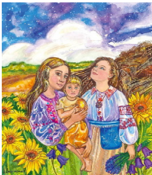
Все буде Україна!

Примітно, що добре серце художниці відгукується не лише на підтримку наших воїнів. Українцям у біді теж старається якось допомогти. Коли до неї звернулася мама хлопчика, хворого на ДЦП, перейнялася ситуацією цієї родини й виділила певну суму із зароблених продажем листівок.