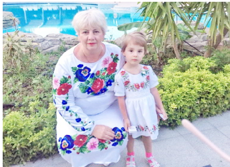
Україночки — онучка Вікуся та бабуся (2018 р.)

інструмента. І ці звички закріплюються протягом тривалих 7 років! Подібних дій вимагає й лапароскопічна методика, коли хірург очима дивиться на екран монітора, руками проводить маніпуляції інструментами в черевній порожнині, а його ноги у цей час