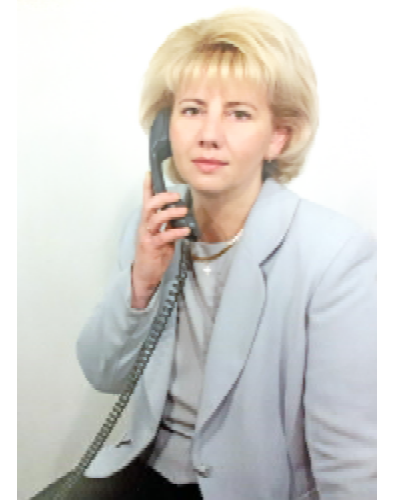
Шалений темп життя (2002 р.)

Студентське життя було дуже цікаве, насичене подіями. Крім навчання, я брала активну участь у художній самодіяльності, співала, грала на гітарі та фортепіано, була активним членом «Інтерклубу». Ми їздили в Орел, Липецьк, Воронеж виступати з агітбригадою, цим дивним дітищем радянської епохи. За що агітували? Напевно, за світле комуністичне майбутнє. Співали українських, пісень, декламували вірші в колгоспах, на фабриках, заводах. Давали по 5-6 концертів. Найбільше запам'яталися українські села у Воронезькій області, і місцеві українці, які просили нас: «Співайте, співайте нашою рідною мовою». Була також учасницею народного ансамблю. Ми співали під супровід українських народних інструментів – цимбал, сопілки,