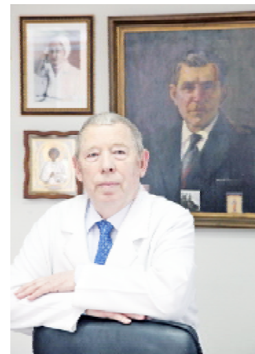
Академік Петро ФОМІН на тлі портретів своїх Учителів — академіка Андрія Савиних і професорки Валентини Рогачової

— Звичайно. Побував майже у сорока країнах світу. Працював сім місяців у Південно-Афри-