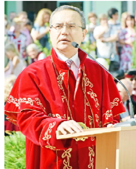
Першокурсників вітає ректор ТНМУ, професор Михайло КОРДА

Відразу хочу сказати, що буде нелегко, але ми впевнені, що ви впораєтесь з цим, бо ж немає в Україні більше таких спеціальностей, для яких не ви- магали 150 прохідних балів із ЗНО, щоб вступити до універ- ситету. Немає інших спеціально- стей, для яких обов'язковим є складання фізики та математи- ки. Ви пройшли ці випробуван- ня. Це означає, що ви з найк- ращих, найдібніших і найтала- новитіших випускників шкіл. Дуже сподіваємося, що продов- жите цей успішний шлях на- вчання в нашому університеті. Адже щоб отримати фах ліка- ря чи стоматолога, провізора чи фізичного терапевта, параме- дика чи медсестри, вам дове- деться багато вчитися. Вивча-