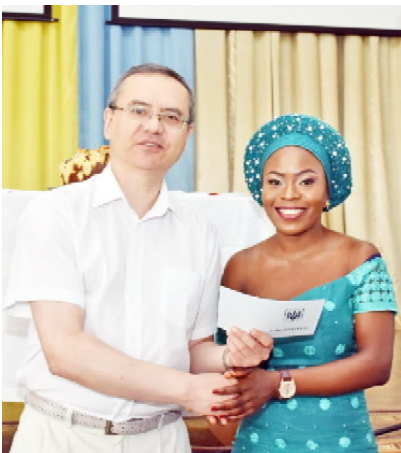
Ректор ТНМУ, професор Михайло КОРДА вручив випускникам підготовчого відділення свідоцтва про завершення навчання

Майже впродовж року молоді люди з різних країн світу вивчали в нашому університеті українську мову та культуру, поглиблювали власні знання з хімії, біології, фізики. Вони при звичаювалися до особливостей життя в Україні та