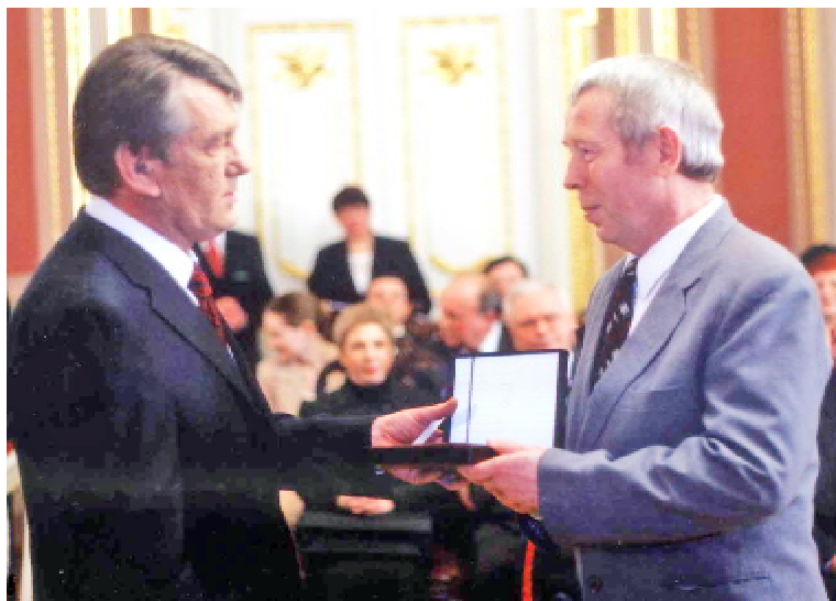
Державну премію України в галузі науки та техніки Петрові ФОМІНУ вручає Президент України Віктор ЮЩЕНКО (2005 р.)

— Тут теж були проблеми. Спекулювали вже долею доньки. Операції проводив, зрозумів, що можу планувати написання докторської дисертації. На кафедрі були три комуністи: один був зятем міністра фінансів, інший — небогою відомого українського композитора, третій — із Західної України, був секретарем парторганізації факультету. Тоді нагороджували значком «Ударник комуністичної праці». На кафедрі вирішують, що у списку представлених на відзнаку має бути моє прізвище. Я ж запропонував ім'я колеги — відомого професора О. Федоровського, якому було вже за 70 років і присвятив він більшу частину свого життя медицині, якого від ув'язнення, заслання врятував Олександр Богомолець. Ввели до списку це ім'я. Секретар партбюро факультету підійшов до мене й каже, що є завдання скласти список осіб, перспективних для вступу в партію. «Треба тобі, то пиши», — кажу. Я був безпартійний. Докторську захищав у Москві. Я тоді був на кафедрі Василя Братуся, який уже не був міністром, але оперував. Він вирішив створити Центр