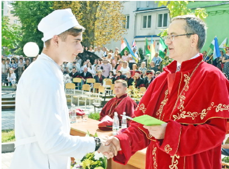
Ректор ТНМУ, професор Михайло КОРДА вручив матрикули студентам, які отримали найвищі бали рейтингу ЗНО, а також з найкращим результатом склали вступні іспити

Другий рік поспіль набираємо на навчання парамедиків. Зараз відбувається реформа в галузі екстреної медичної допомоги. Наш університет – один з двох, який готує спеціалістів, які працюватимуть у новій системі ЕМД. Ви саме ті люди, які, без перебільшення, кілька разів на день рятуватимуть життя людей на місцях ДТП, нещасних випадків, стихійних лих і т.д. Ви повинні будете надати першу допомогу, стабілізувати стан хворого чи