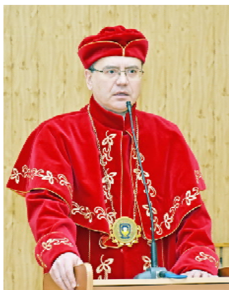
Михайло КОРДА – ректор ТДМУ, професор вітає випускників

Урочисте засідання вченої ради Тернопільського державного медичного університету імені І.Горбачевського з нагоди сьомого випуску провізорів фармацевтичного факультету заочної форми навчання відбулося 26 грудня 2018 року в адміністративному корпусі вишу.