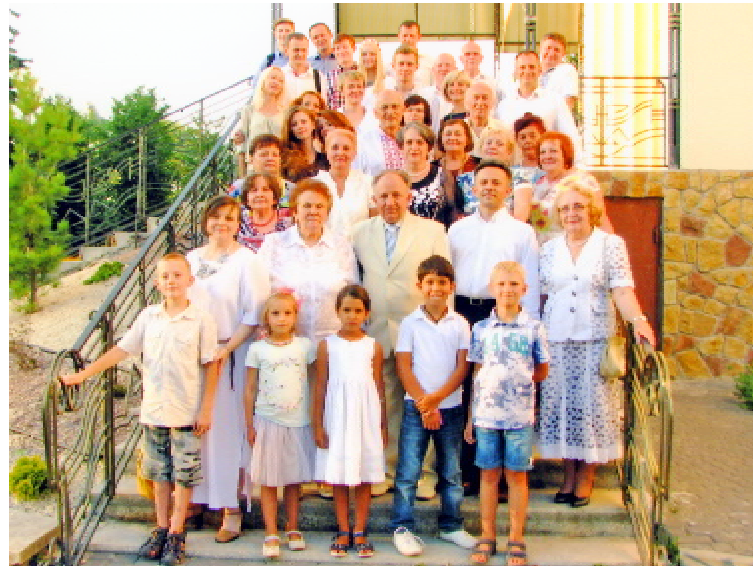
У колі рідних і друзів у день золотого весілля (2015 р.)

практику відповідні рекомендації щодо ведення передопераційного та післяопераційного періодів у хворих на тиротоксикоз. У подальшому брав участь у ви-