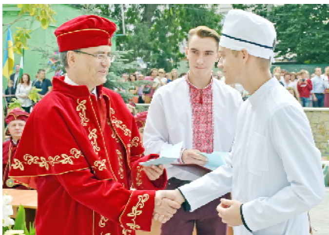
Матрикули студентам, які отримали найвищі бали рейтингу зовнішнього незалежного оцінювання, а також з найкращим результатом склали вступні іспити, вручив ректор ТДМУ, професор Михайло КОРДА

– Ви успішно склали всі необхідні іспити та випробування. Сьогодні приєднуєтесь до когорти студентів Тернопільського державного медичного університету, стаєте члена-