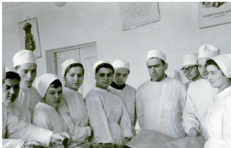
Під час занять з анатомії на першому курсі Тернопільського медінституту (1962 р.)

Дуже хотів все власними очима побачити. Нині здається, що не так просто було потрапити, але все складалося доволі легко – наш інститутський відділ кадрів саме набирив фахівців на ці вакансії. Міністерство охорони здоров'я дало певну квоту в нашу область і так з'явилася можливість поїхати до Алжиру. Підписав контракт на три роки. Оселилися з дружиною та ще двома родинами в місті Скікда, недалеко від радянського кон-