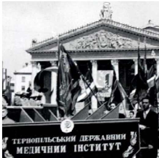
Емблема «Чаша та змія» перед святковою колоною (1958–1959 навчальний рік)

У Тернопільському медінституті ця емблема вперше з'явилася 1971 р. на запрошенні на ювілейну зустріч з нагоди 10-річчя першого випуску лікарів у варіанті «серце на лівій долоні» — як в оригіналі. Проте на аналогічному запрошенні лікарів другого випуску (1972 р.) варіант