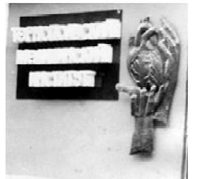
Емблема «Серце в долонях» (друга половина 1970-х років)

лено стэнд з її рельєфним зображенням. Викарбував у міді емблему студент І.А. Булдаков. Цей стэнд тривалий час знаходився на стіні вестибюлю адміністративного корпусу навпроти центрального входу. Під час святкових демонстрацій його несли перед інститутською колоною. Цією ж емблемою прикрашали заголовні стенди інституту на міських виставках.