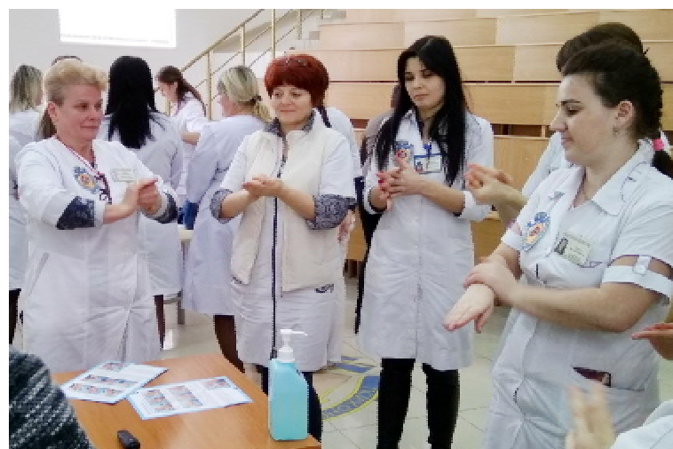
Під час проходження тесту «чистих рук»

настанови повинні стати головним документом. У нашому медзакладі розроблені такі настанови, але в процесі роботи ми зрозуміли, що потрібно ще їх доопрацювати, більше адаптувати до сучасних вимог. Узагалі ж дії медичних сестер у будь-яких медичних випадках мають бути відпрацьовані практично до автоматизму. Візьмемо, до прикладу, ситуацію, коли пацієнтові призначили проведення тромболізу при ішемічному