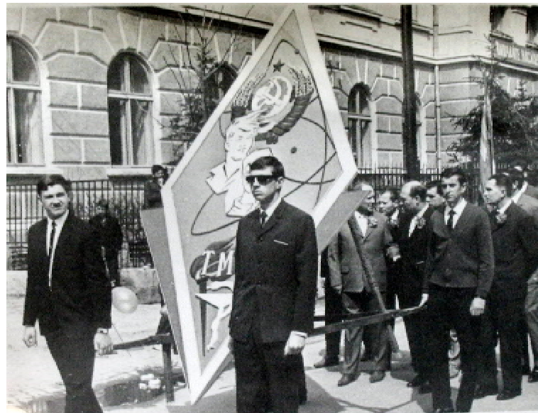
Емблема у вигляді ромба (1 травня 1969 р.)