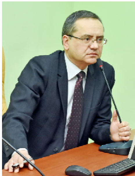
Михайло КОРДА, ректор ТДМУ, професор, під час зустрічі зі студентським активом

Майбутні медики поділилися своїми планами щодо організації акцій та подій. Зокрема, за їхніми словами, активно йде підготовка до оформлення «Тролейбуса здоров'я». Головна мета – пропагувати