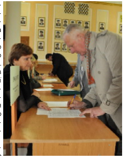
Реєстрація учасників зборів

Активну участь в обговоренні Статуту та кандидатур до складу правління Асоціації взяли випускники університету, серед яких – відомі вчені, викладачі, лікарі та організатори охорони здоров'я. Після внесення доповнень і