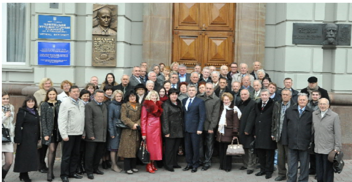
Фото на згадку про участь в установчих зборах громадської організації «Асоціація випускників Тернопільського державного медичного університету імені І.Я. Горбачевського»