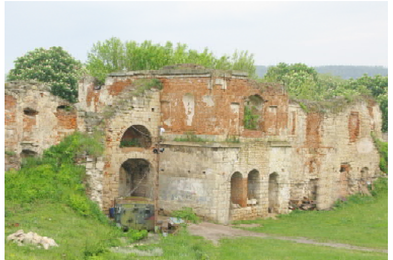
Руїни давнього замку

Дивно, але після Синявських нові власники замку не зважали на те, що це одна з найкращих таких тогочасних споруд. Більше того, у вісімдесятих роках XVIII ст. у замкових приміщеннях австрійська влада розташувала власні війська, а відтак узагалі взялися позбавляти фортецю її природних і штучних фортифікаційних можливостей — зрівнюватиме оборонні вали, засипатиме рови й канали, осушуватиме навколишнє болото. Але після критичних звернень співвітчизників 1878 року Станіслав Потоцький ініціював, щоправда, не на тривалий період, проведення у фортеці (зокрема, в замковому костелі) реставраційних робіт. Перша світова війна стала початком руйнації замку. Взагалі ренесансному архітектурно-оборонному шедевру довелося бути за свою історію також військовою казармою і навіть броварнею, де варили пиво. Це, безумовно, шкодило. Проте є й позитивний приклад, який показав саме офіцер. У двадцятих-тридцятих роках минулого століття тут дислокувався полк польських прикордонних стрільців. Їхній командир Станіслав Відацький виявився солдатом, а поціновувачем прекрасного. Тож за його почи-