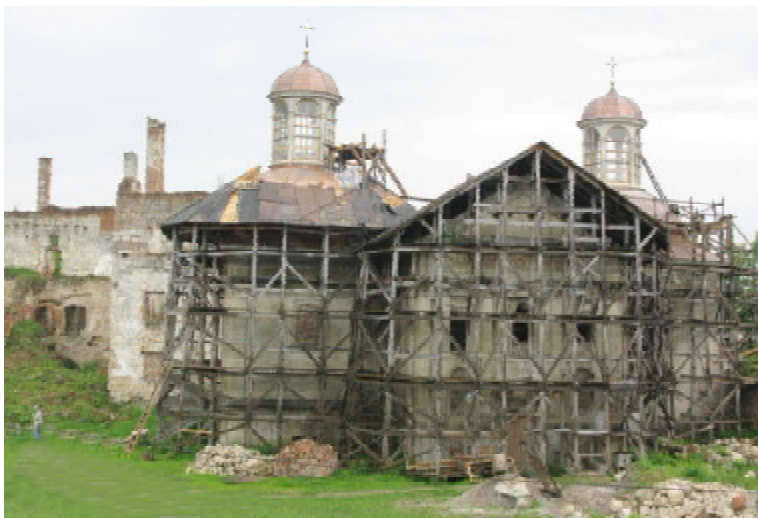
Замковий Троїцький костел-усипальниця — у риштуваннях

замковий костел посів центральне місце у композиції внутрішнього екстер'єру. Цікаво, що фортецю майже ніколи не перебудовували, а лише добудовували, зберігаючи при цьому попередні архітектурні елементи.