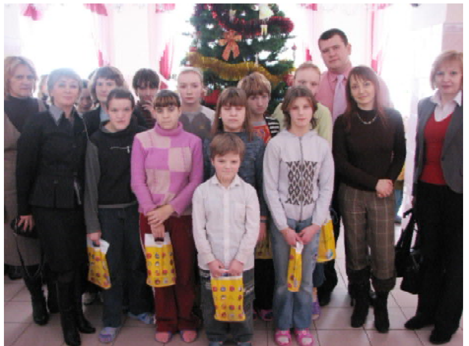
Співробітники ТДМУ серед вихованців Петриківського будинку-інтернату

печити дітей в достатній кількості необхідним харчуванням на зиму, працівники дитбудинку самі працюють на земельній ділянці в літньо-осінній період, а діти допомагають їм в цьому, таким чином адаптуючись до умов життя у спільстві. Дитячий будинок має свою господарку, де вирощують усі необхідні овочі та фрукти, а також швейний цех, де руками дітей виготовляють необхідну постільну білизну. Звичайно, держава робить багато для того, щоб діти в подібних закладах почували себе, як удома. Але водночас хочеться висловити глибоку подяку керівникам та вихователям будинків-інтернатів. Велике щастя, що на землі ще не перевелися люди з добрим серцем і щедрою душею. Що вони