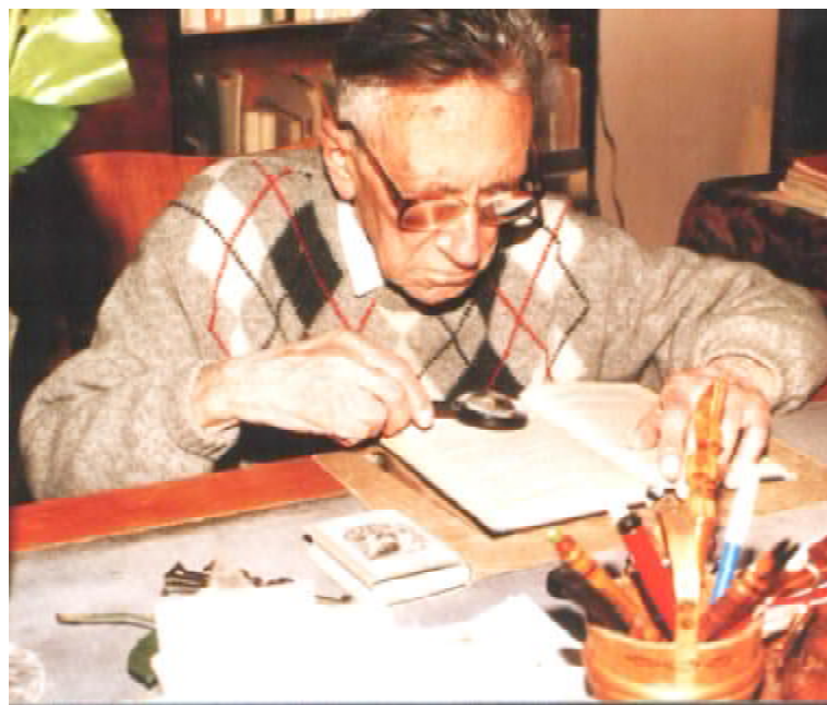
У домашньому робочому кабінеті (15 січня 1998 р.)

Третій розділ виставки присвячений громадській діяльності. Це