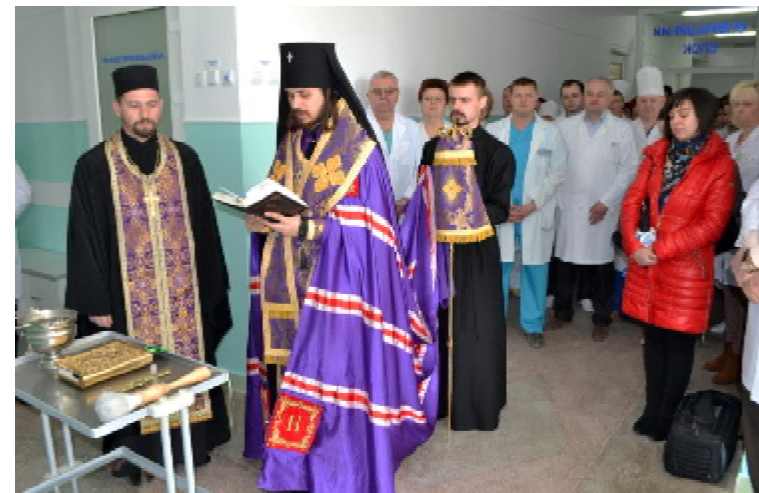
Архієпископ Тернопільський, Кременецький і Бучацький Нестор освячує операційний блок

— Щоб надати кваліфіковану стоматологічну допомогу, на рік проводимо майже 800 оперативних втручань на