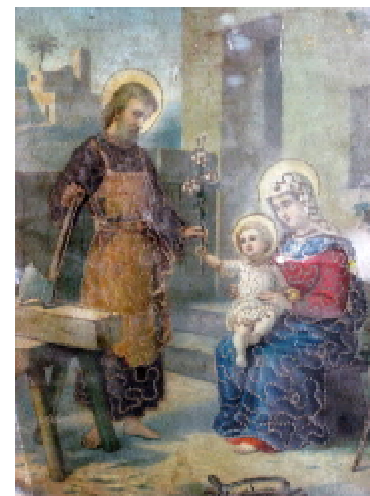
Пресвята Родина: Йосип-тєсля та Богородиця з маленьким Ісусом

викликала у військових моряків протичовнового корвета «Тернопіль», які певний час відпочивали у краї після російського загар-