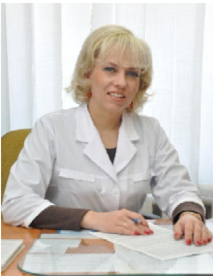
Від усього серця вітаю Вас з професійним святом – Всесвітнім днем медсестер! У всі часи зосередженням ми-

лосердя були жінки, яких за особливо чуйне серце, добрі руки та велике терпіння назвали сестрами. І мабуть, не випадково, що важка місія медичної сестри здебільшого лягає на тендітні жіночні плечі.