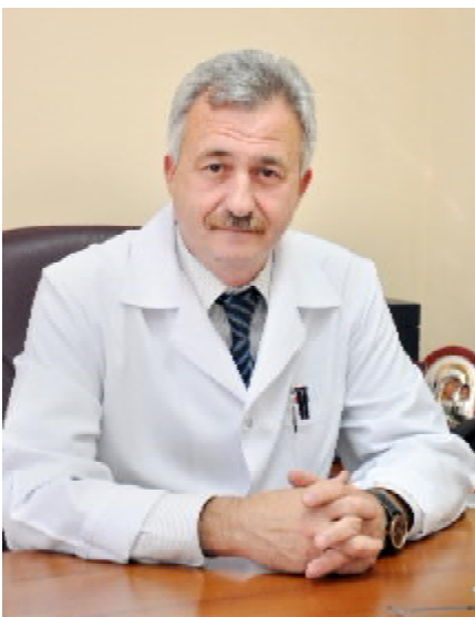
Від усього серця вітаю Вас з професійним світом – Всесвітнім днем медичних сестер! Цього дня найщиріші

слова подяки звучать на Вашу адресу. Адже у найтяжчі моменти життя Ви приймаєте на себе частину людського горя, полегшуєте страждання, спільно з лікарем повертаєте здоров'я та радість буття.