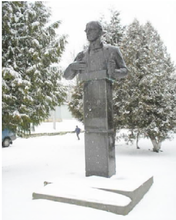
Пам'ятники Тарасові Шевченку в Чорткові (ліворуч) та Ярославові Стецьку в с. Кам'янки Підволочиського району