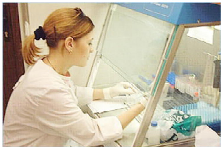
Робота в ПЛР-лабораторії ФДУН ЦНДІЕ