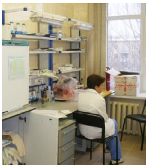
Лабораторія з вивчення дисбіотичних станів організму людини Московського науково-дослідного інституту епідеміології й мікробіології ім. Г.Н.Габричевського

беруть на себе зобов'язання підвищувати кваліфікацію виконавців цієї угоди шляхом проведення науково-практичних семінарів, надання тимчасових ро-