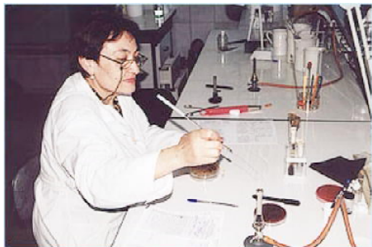
У лабораторії клінічної мікробіології й мікробної екології