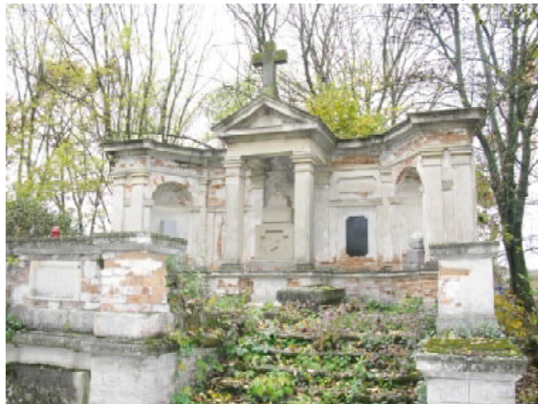
Мавзолей-усипальниця графської родини Пайгертів на сільському цвинтарі

За кількадесят метрів від церкви є ще одна архітектурна пам'ятка (пізнє бароко) — костел св. Миколая. Він, кажуть, став одним