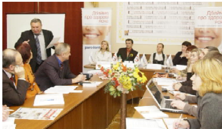
Під час роботи «круглого столу»

донині в штатному розкладі державних поліклінік така посада не передбачена, отож питання, в який спосіб надавати допомогу хворим, залишається відкритим. Звісно, допомагають приватні стоматологічні клініки та фармацевтичні компанії, скажімо, цього року компанія «ГлаксоСмітКлайн Хелскер» (Великобританія) разом з Асоціацією лікарів-пародонтологів розпочала впроваджувати у життя Всеукраїнську освітню програму «Дбаймо про здорові ясна», аби надати необхідні знання про засоби гігієни ротової порожнини та захворювання тканин пародонту, що виникають за відсутності своєчасного лікування. Представники цієї компанії зустрічаються з лікарями-пародонтологами, роздають їм безкоштовно свій продукт – лікувально-профілактичну пасту «Пародонтас», яка попереджує захворювання ясен. Хворі вже отримали сімсот тисяч зразків продукції цієї компанії. Ця паста – один із засобів, який рекомендує до використання й Українська асоціація лікарів-пародонтологів.