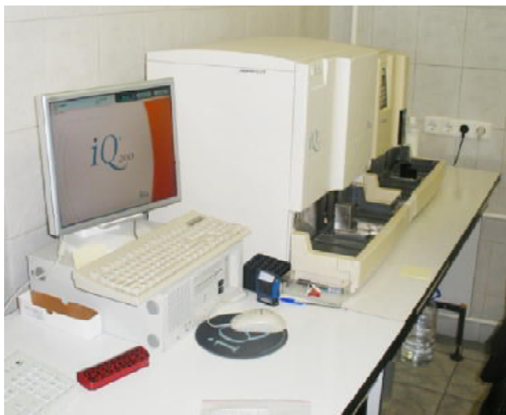
Центр молекулярної діагностики інфекційних хвороб ФДУН ЦНДІЕ

інфекційних захворювань людини та тварин Г.О. Шипулін провів мультимедійну презентацію цієї лабораторії та zorganizував для