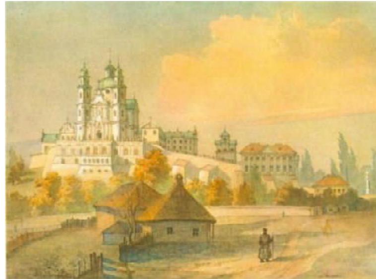
Т. Шевченко. Почаївська лавра з півдня. 1846 р.

Тарас Григорович Шевченко — велика історична постать. Він, безумовно, був могутнім велетом духу. Великий Кобзар у корені змінив психологію українців, змусив їх думати, подарував іскру, бажання бути незалежним. Для мене Шевченко — приклад незламності духу, шляхетності, людяності. З його творів я почерпнув для себе багато нового й важливого.