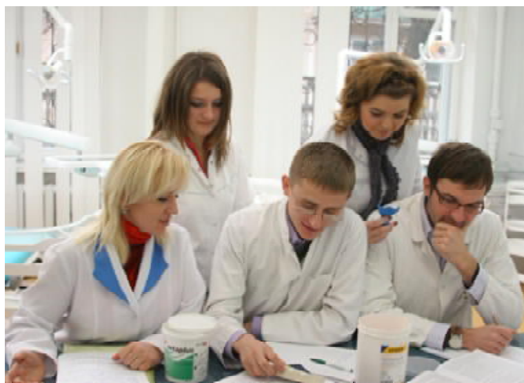
Студенти VII групи п'ятого курсу стоматологічного факультету