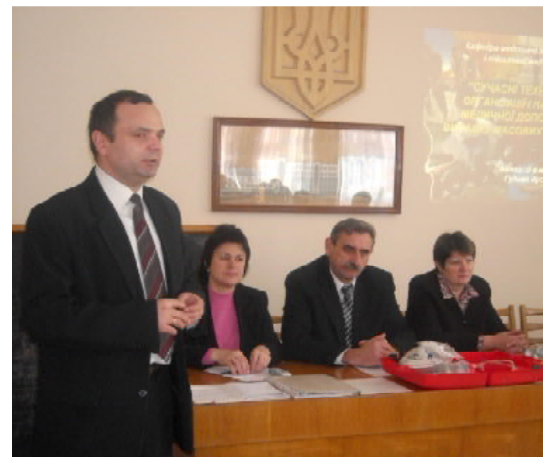
Виступає завідувач кафедри медицини катастроф і військової медицини Тернопільського державного медичного університету, професор Арсен ГУДИМА

Під час практичного семінару працівникам бригад «103» Тернопільського району ще раз нагадали, як потрібно правильно й своєчасно надати медичну допомогу на місці ДТП, провести «сортування» потерпілих (кого найперше потрібно шпиталізувати), поінформувати диспетчера