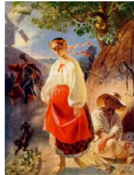
Т. Шевченко. Катерина. 1842 р.

Чи є серед ваших знайомих людина, яка обере заслання і смерть, але не зверне зі шляху служіння своєму народу? Відповім за вас: немає. Саме тому Т.Г. Шевченко справедливо заслуговує звання генія, народного героя, націоналіста.