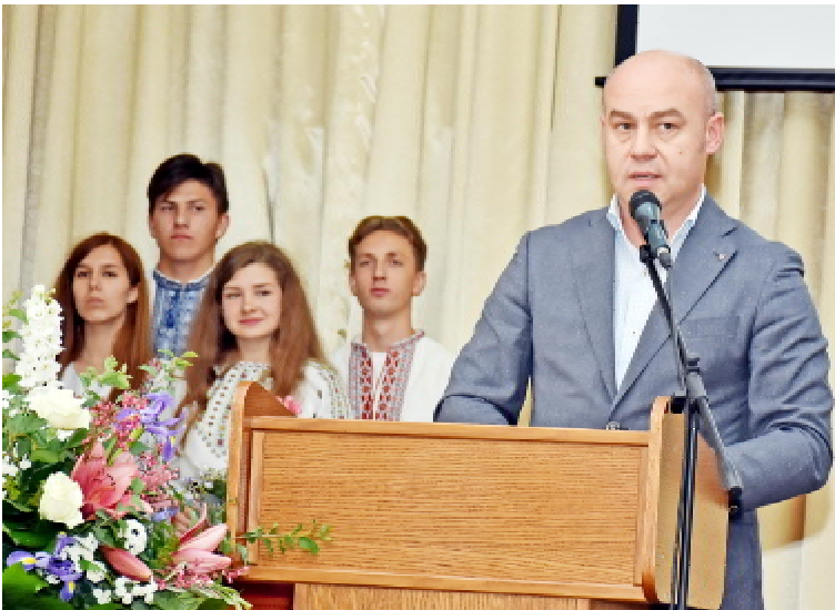
З вітальним словом — міський голова Тернополя Сергій НАДАЛ

ти в єдиному професійному світовому чи європейському просторі, гостро стоять питання і реформування самої системи медичної освіти. Ще раз складаю подяку за вашу титанічну, відповідальну працю. Адже від вас значною мірою залежить, яким буде завтрашня медицина. Не шкодуйте віддавати знання, не втомлюйтеся вчити та передавати навички. Бо ваше покликання — виховувати не лише нову медичну еліту України, а й нового громадянина. Успіхів вам на цьому шляху! Подяка й вашим студентам — майбутнім медикам, які дуже активно долучаються до волонтерського руху. Удачі вам та міцного здоров'я!».