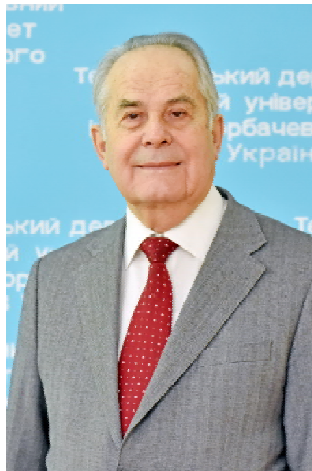
Михайло АНДРЕЙЧИН – завідувач кафедри інфекційних хвороб з епідеміологією, шкірними і венеричними хворобами ТДМУ, президент Всеукраїнської асоціації інфекціоністів, академік НАМН України, професор

До того ж нині їх практично прирівняли до терапевтичних хворих – під час шпиталізації в інфекційній стаціонар їм пропонують платити «добровільний внесок» на підтримку лікувального закладу, а потім ще й за обстеження та лікування. Зважаючи на те, що інфекції зазвичай обирають соціально незабезпечених осіб, яким не під силу такі витрати, тож вони відмовляють-