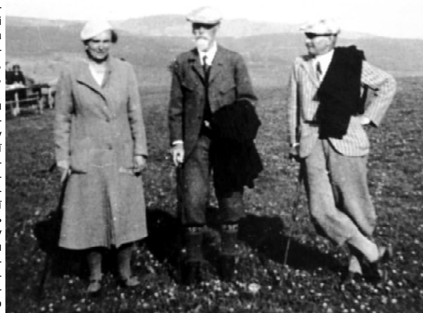
Іван Горбачевський (у центрі) з молодшою донькою Марією (Асеєю) на відпочинку (1933 р.)

Видатним теоретичним і практичним здобутком української науки були підручники «Неорганічна хімія» та «Органічна хімія», які написав Іван Горбачевський упродовж 1921-1923 рр. «щоби вдовольнити бажання слухачів і тому, що потреба більшого підручника в українській мові відчувалася вже віддавна». Другий з них – «Органічна хімія» (вид. 1924 р.) – засвідчив пильну роботу вченого в царині української хімічної термінології, започатковану публікаціями 1901 року та його одностайну позицію в цьому питанні: І. Горбачевський вважав, що, крім народної, треба використовувати міжнародну термінологію, аби полегшити українським хімікам сприймати та засвоювати здобутки світової науки. Цій проблемі присвячена остання велика наукова праця «Теперішній стан української номенклатури неорганічної хімії» (1941 р.), яка була опублікована у серії матеріалів з українознавства, яку заснував