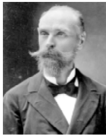
ДО 170-РІЧЧЯ ВІД ДНЯ НАРОДЖЕННЯ ІВАНА ГОРБАЧЕВСЬКОГО

15 травня виповнюється 170 років з дня народження нашого славетного краянину, видатного вченого, громадсько-політичного та освітнього діяча Івана Яковича Горбачевського, ім'я якого Тернопільський національний медичний університет носить з 1992 року. Як відзначатимемо цей ювілей у нашому виші? Що заплановано до цієї урочистої дати та що вже зроблено? Ці та інші запитання поставили ректорів ТНМУ, професору Михайлові КОРДА.