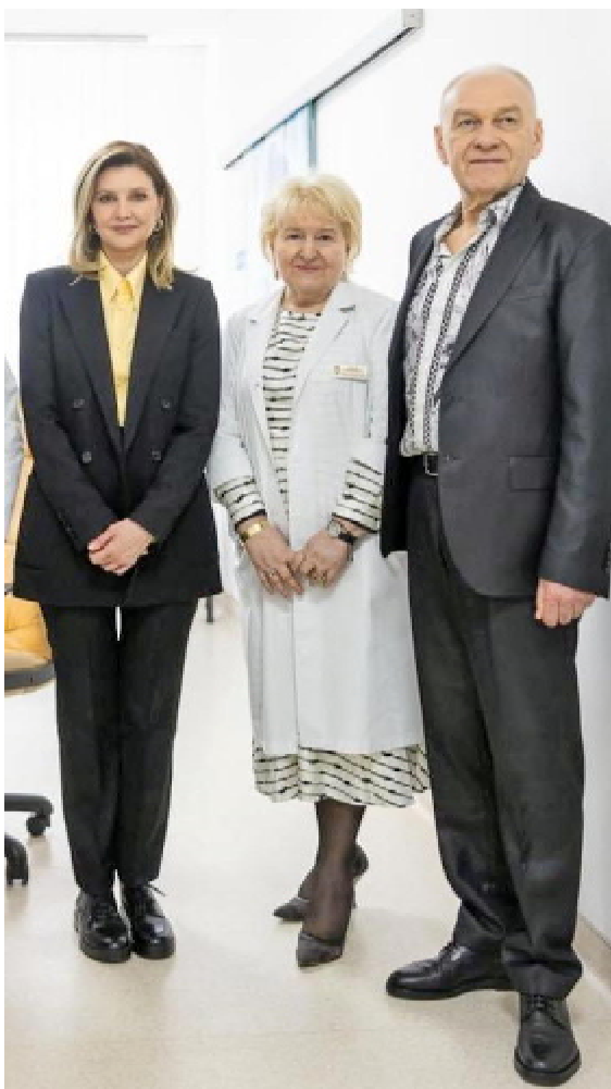
Перша леді України Олена ЗЕЛЕНСЬКА, завідувачка кафедри неврології ТНМУ, професорка Світлана ШКРОБОТ, керівник Тернопільської обласної клінічної психоневрологічної лікарні Володимир ШКРОБОТ

– Я пригадую цю розмову та що я йому на те відповів. Сказав: тоді, Івасю, (саме так він просить до нього звертатися), коли ти зупинишся, бо в такому поважному віці все ще продовжуєш малювати (усміхається, прим. авт.)