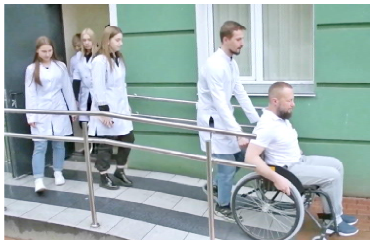
Студенти під час практичних занять з використанням технічних засобів (крісла колісні)

Під час практичних занять у кабінеті доклінічної практики майбутні фізичні терапевти відпрацьовують фахові навички безпечного та ефективного забезпечення допоміжними засо-