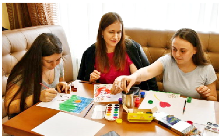
Під час арт-терапії присутнім запропонували спробувати техніку малювання

десятиліттями, відтак – кожен з нас не певен, що на нього чекає завтра. Тому й, як свідчать соціологічні опитування, які оприлюднило торік Міністерство охорони здоров'я, понад 90% українців мають хоча б один з симптомів тривожних розладів, а 40-50% потребують психологічної підтримки різної інтенсивності. До того ж 66% українців не знають, куди вони могли б звернутися за допомогою в разі необхідності, а насправді за допомогою звертається лише 6% громадян. Це глобальна проблема сьогоден-