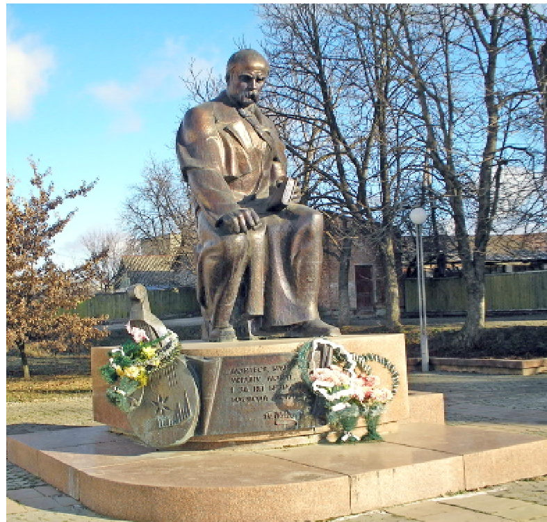
Пам'ятник Тарасові Шевченку в м. Борщів, що на Тернопіллі (скульптор Іван Сонсядло)

Зірки зійшли у небі пурпурові. Сочилась кров у серці... З тої крові