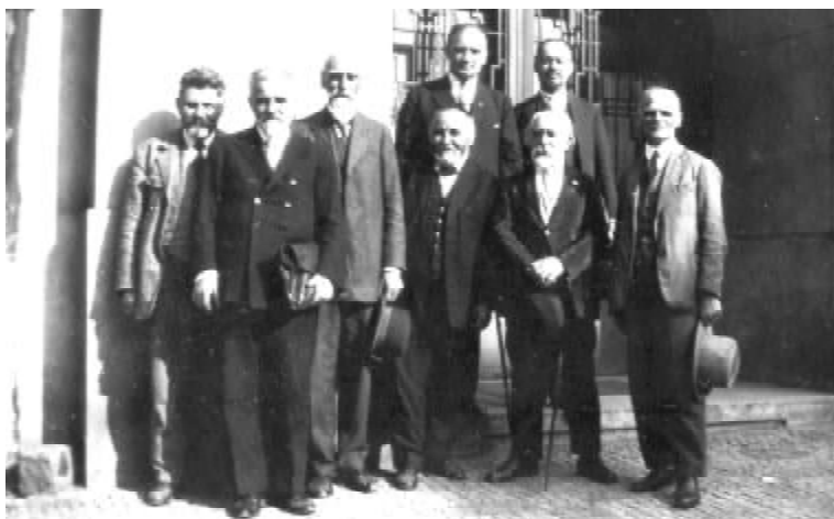
Провід Музею визвольної боротьби України (1929 р.). Зліва направо: В. СИМОНОВИЧ, Д. АНТОНОВИЧ, Іван ГОРБАЧЕВСЬКИЙ, В. БІДНОВ, І. ОМЕЛЯНОВИЧ-ПАВЛЕНКО, К. ЛИСЮК, невідомі особи

Про світовий авторитет і популярність Івана Горбачевського твердять ті чисельні наукові та урядові титули, звання й нагороди, яких він був удостоєний. Його обирали почесним президентом міжнародних наукових конгресів і з'їздів, йому доручали найскладніші завдання в медицині, охороні здоров'я, організації освіти, розробці заходів з усунення шкідливих техногенних впливів на людину. І скрізь він приймав неординарні рішення, знаходив геніальні шляхи виходу зі складних ситуацій.