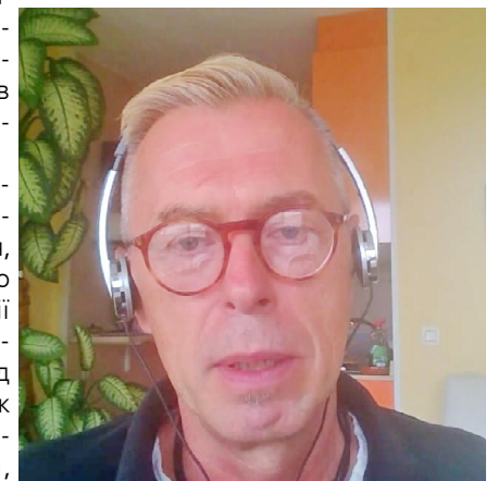
Голова правління Євразійського альянсу з глобального здоров'я, професор Олаф ХОРСТИК (Німеччина)

для академічних установ євразійського регіону, яка може допомогти цим країнам підвищити свою професійну компетентність у галузі глобальної охорони здоров'я, щоб міцно утвердитися на світовій арені.