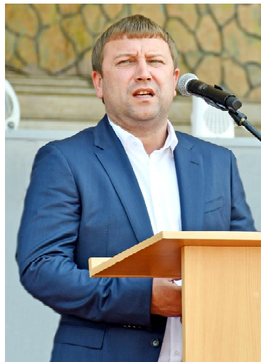
Голова Тернопільської облдержадміністрації Володимир ТРУШ

ною подією у вашому житті. Сьогодні ви отримуєте квиток у самостійне майбутнє. Перенесіться подумки на хвилину на 5-6 років назад. Згадайте заповнену щасливими посмішками нових студентів нашого університету урочисту залу палацу культури «Березіль» ім. Леся Курбаса. Ви щойно пройшли посвяту та матрикуляцію. Тоді вам здавалося, що