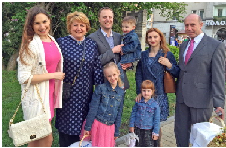
Родина Вадзюків після освячення паски (2015 р.)

свою першу поїздку за кордон і жартую, що таку визначальну для нашої державності звістку, як проголошення Незалежності України, зустрів над Атлантичним океаном. Коли настали часи Горбачовської «перебудови», з'явилася можливість відвідати США, де мешкають родичі моєї дружини, от ми й поїхали. Залишили СРСР, а повернулися в Україну. Пригадуєте, путч, бурхливі події, танки на вулицях, сутички з міліцією... Зв'язок з Батьківщиною припинився, а ще мені тоді не давало спокою, чи вдасться провезти через митницю підручник з фізіології, який у США придбав. Але дісталися Тернополя благополучно, ніхто нас не затримав і я окрилений, з книжкою в руках, як і годиться, прийшов першого вересня на кафедру, щоб розпочати навчання за американським підручником. Зараз про це з нотками гумору згадую, а тоді було справді трохи моторошно. Щодо книжки, то багато нового та корисного почерпнули з неї для організації навчального процесу, який з 1991 року розпочали по-новому. По суті, до мінімуму звели виконання лабораторних робіт на тваринах, тобто перевели фізіологію в площину функціональної діагностики. Як показав час, ми спрацювали на випередження. Адже вже згодом на Заході почали вести мову про біоетику, запровадження засад біоетики в навчальний процес, щоб відмовитися від застосування в медичних вишах, на факультетах біологічного спрямування від виконання дослідів, результати яких