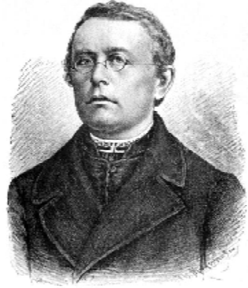
був перший такий посібник в Україні.

Згодом вступив до Львівської духовної семінарії. Заняття музикою не перервалися: молодий семінарист керував хором навчального закладу, опанував гру на гітарі, яка супроводжувала його протягом усього життя. Численні його твори для гітари здобули широку популярність. До нашого часу збереглося «Почуєніє Хітари», яке він створив. Це