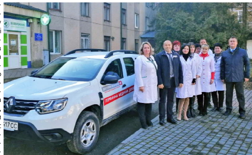
Коллектив КНП «Центр первинної медико-санітарної допомоги» Підволочиської селищної ради

Щодо медичних сестер, то їхня зарплатня також дещо зросла, але вона залежить від того, скільки коштів надійшло до сімейного лікаря, з яким працює. Наразі нас турбує майбутнє фельдшера сільського ФАПУ чи пункту здоров'я, який також є помічником сімейного лікаря, але в нього не менше обов'язків. Як відомо, ця людина працює практично без вихідних, і надає медичну допомогу, як мовиться, вже й тепер, тому для сільських