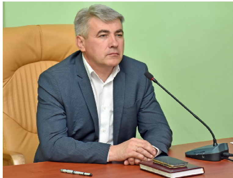
Проректор з науково-педагогічної роботи ТНМУ, професор Аркадій ШУЛЬГАЙ

та дизайну, Тернопільський національний педагогічний університет імені В.Гнатюка, Рівненський державний гуманітарний університет, Інститут фізико-органічної хімії і вуглехімії імені