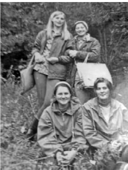
На практиці з ботаніки (1975 р.)

Окрім музики, в шкільні роки батьки прищепили мені любов до книжки, художньої літерату-