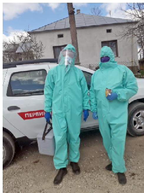
Члени мобільної бригади

шер також мають підвищену зарплатню. Зараз у складі бригади працює чотири працівники, запит на виїзд до пацієнта вони отримують від сімейного лікаря. Виїзять до хворого, проводять забір біоматеріалу для