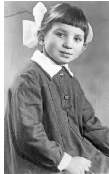
Іринці виповнилося 7 років (1962 р.)

Крім цього, студенти-природнички вивчали назви рослин і тварин латиною. Під час навчання ми вважали це зайвим. Зате потім, під час роботи в школі чи практики, можна було похизуватися своєю ерудицією перед уч-