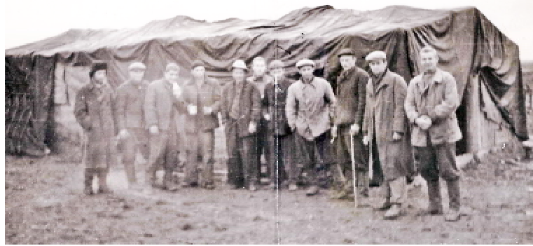
Тернопільські студенти-медики біля намету (вересень 1958 р.)

У числі добровольців з Тернопільщини були представники