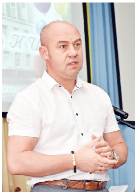
Тернопільський міський голова Сергій НАДАЛ

цювати в практичній охороні здоров'я та рятуватимуть людям життя. Університету вже 62 роки, а це десятки тисяч наших випускників, які працюють в Україні та багатьох інших країнах. Серед них є відомі організатори системи охорони здоров'я, вчені, науковці, проте найвагомим внеском нашого університету якраз є та велика кількість лікарів, які щодня працюють у практичній медицині, бо від їхньої роботи залежить життя і здоров'я нашого народу. Пишаємося своїми викладачами, які є високопрофесійними клініцистами. Понад 60