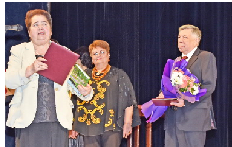
Вітання – від колег

«Від імені усієї громади Тернополя, міської ради та від себе особисто висловлюю щире подяку за Вашу щоденну багаторічну працю, за те, що на Вашо-