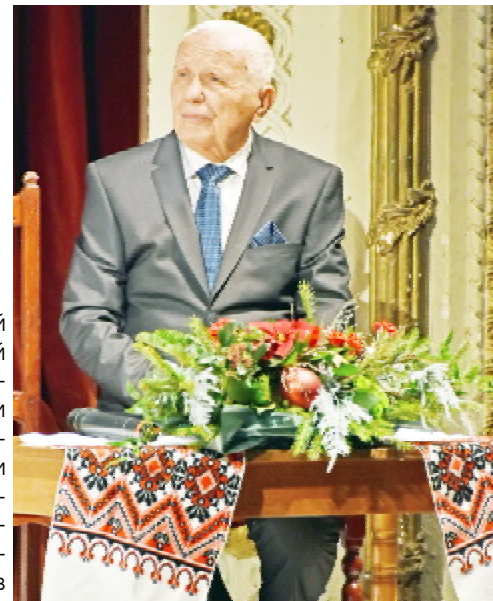
Іван СМІЯН, член-кореспондент Національної академії медичних наук України, заслужений працівник вищої школи України, доктор медичних наук, професор

Сьогодні колектив медичного університету вітає Вас з цим славним ювілеєм. Бажаємо Вам насамперед творчого та активного довголіття. Сподіваємося в такому ж оточенні й у цих же стінах 10 січня відзначити Ваш столітній ювілей. Знаємо, що Ви маєте багато планів щодо написання книг. Нехай ці плани й мрії здійсняться. Нехай ті знання, зусилля та час, які Ви вклали у своїх пацієнтів і учнів, повернуться до вас доб-