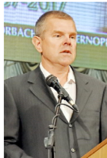
Колишній в. о. міністра охорони здоров'я України Віктор ШАФРАНСЬКИЙ