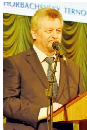
Президент НАМН України, академік, професор Віталій ЦИМБАЛЮК

охорони здоров'я. Серед наших випускників є академіки, міністри охорони здоров'я та їхні заступники, керівники великих медичних компаній. Ми пишаємося тим, що президентом Національної академії медичних наук України є наш випускник Віталій Цимбалюк, а також колишній в.