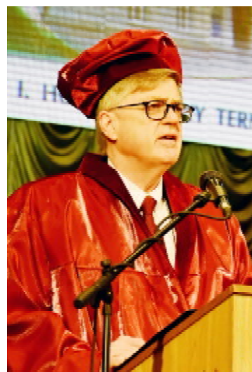
Президент Університету імені Грента МакЮена (Канада), професор Девід АТКІНСОН