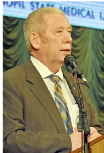
Академік НАН України та НАМН України, професор Петро ФОМІН

Від Національної академії медичних наук України виступив випускник університету, президент Національної академії медичних наук України, академік,