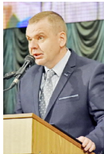
Директор департаменту гуманітарної та соціальної політики Кабінету Міністрів України Віталій КОБЛОШ

Цього знаменного дня Тернопільський державний медичний університет за результатами сертифікаційного аудиту, проведеного зовнішніми аудиторами компанії Бюро Верітас Сертифікейшн Україна, отримав серти-