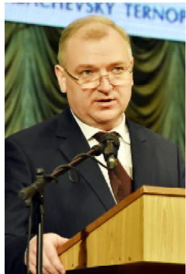
Заступник керівника головного департаменту з питань гуманітарної політики, керівник департаменту з питань охорони здоров'я та соціальної політики Адміністрації Президента України, професор Ігор ЛУРІН

ти якраз буде лише в цьому напрямку. Я мав щастя і велике задоволення спілкуватися з усіма ректорами. Нашим першим ректором був Петро Огій. Гетьмана я пам'ятаю як молодого асистен-