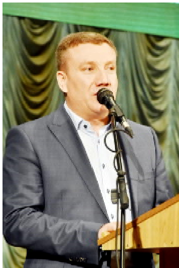
Народний депутат України Роман ЗАСТАВНИЙ