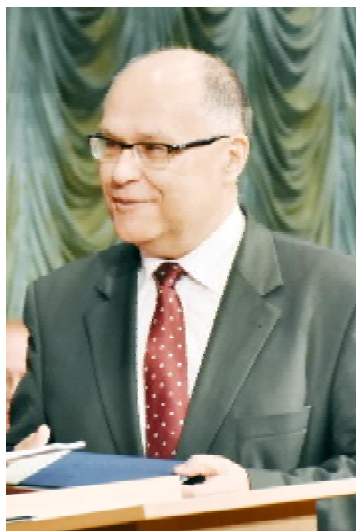
Ректор Жешувського університету (Польща), професор Сильвестр ЧОПЕК

«Це велика честь, якої удостоїв мене Тернопільський державний медичний університет сьогодні. Пам'ятати про це дуже довго. Водночас для мене велика честь перебувати сьогодні на святкуванні. Вітаю вас з цим ювілеєм. Між Канадою та Україною тривала й спільна історія. Як громадяни Канади, маємо великий борг перед всіма українцями, адже українські емігранти багато зробили для нашої країни, коли вони почали освоювати Захід Канади. Ця історія триває досі – українці й надалі збагачують нашу країну. Виконую ще одну місію – висловлюю вдячність за внесок українців у розвиток Канади. Такі святкування дають можливість згадати минуле. Ви можете побачити, як зріс ваш університет за ці роки. Всі, хто працював і навчався тут, доклали свою частку душі до цього поступу. Це важ-