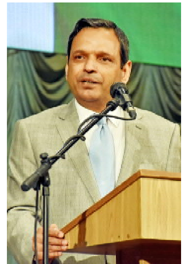
Надзвичайний та Повноважний посол Ісламської Республіки Пакистан в Україні Атар Аббас

Академік Національної академії наук України та академік Національної академії медичних наук України, заслужений діяч науки і техніки України, професор Петро Фомін передав вітан-