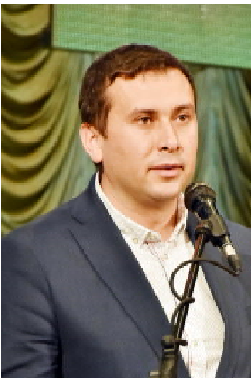
Народний депутат України Тарас ЮРИК