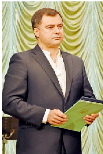
Народний депутат України Тарас ПАСТУХ

тичній галузях. Значний досвід роботи з формування і впровадження інноваційних засад, підготовки майбутнього медичного працівника, справедлива вимогливість до знань студентів, натхненність викладачів у наукових пошуках.