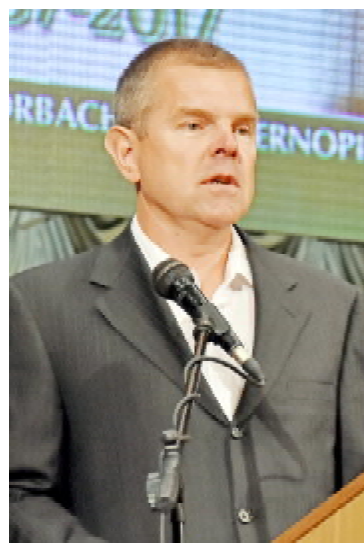
Колишній в. о. міністра охорони здоров'я України Віктор ШАФРАНСЬКИЙ