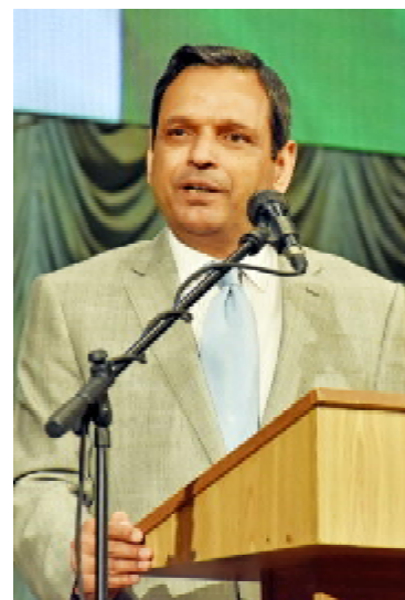
Надзвичайний та Повноважний посол Ісламської Республіки Пакистан в Україні Атар Аббас

фармацевтів. Висловлюємо глибоку подяку й шану всьому колективові університету та зичимо успіхів у плеканні молодії надії нашої держави. Нехай натхнення й жага творчого пошуку будуть вашими вірними