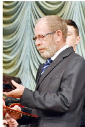
Ректор Вищої школи безпеки у Познані (Польща), професор Анджей ЗДУНЯК

заклад підписали угоду про співпрацю. Для мене це велика честь як для науковця отримати титул почесного професора. Переконаний в поглибленні нашої подальшої співпраці. І зараз хочу