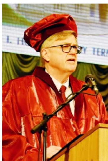
Президент Університету імені Грента МакЮена (Канада), професор Девід АТКІНСОН