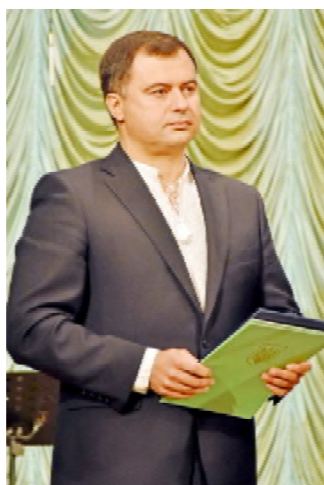
Народний депутат України Тарас ПАСТУХ

«Щиро від себе особисто та всіх тернополян вітаю вас із 60-