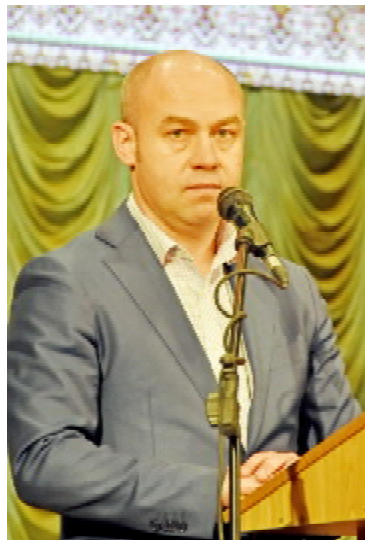
Міський голова Тернополя Сергій НАДАЛ

Упевнений, що завдяки високому професіоналізму, завзятості та цілеспрямованості працівників університет здобуде нові рубежі в підготовці конкурентоспроможних фахівців на українському та міжнародному ринках праці. Бажаю всім міцного здо-