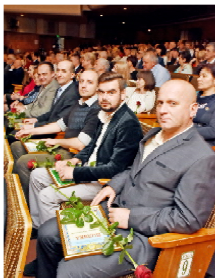
У святковій залі – учасники бойових дій

річчям університету. Тернопільський медичний університет завдяки праці викладачів, студентів, співробітників став одним з визначних центрів медичної науки не лише України, але й Європи. Нині тут мають за честь навчатися студенти з багатьох країн світу. Зокрема, за останні десять років кількість іноземних студентів зросла майже у чотири рази. Університет регулярно отримує нагороди. І таке визнання свідчить про високий рівень викладання та організації навчального процесу на рівні провідних навчальних закладів Європи, – зазначив міський голова Тернополя Сергій Надал. – З гордістю констатуємо, що ТДМУ успішно реалізує свою місію з підготовки висококваліфікованих фахівців медичної сфери та розбудови сучасного науково-практичного центру медицини».