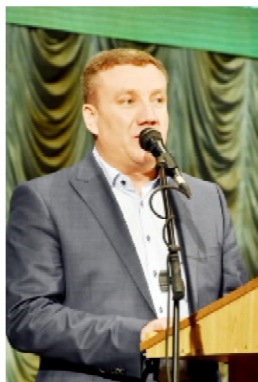
Народний депутат України Роман ЗАСТАВНИЙ

олімпіад, 17 всеукраїнських навчально-методичних конференцій, стратегій розвитку медичної та фармацевтичної освіти, понад 1000 форумів міжнародного і всеукраїнського рівнів. У стінах закладу було захищено понад 1000 дисертацій, серед яких більше 200 докторських. Тернопільський державний університет імені І.Горбачевського відомий також міжнародною співпрацею, програмами обміну студентів тощо. Виш успішно співпрацює з 55 закордонними