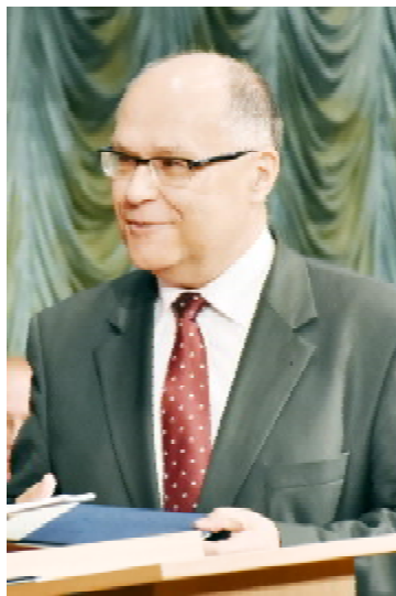
Ректор Жешувського університету (Польща), професор Сильвестр ЧОПЕК

в інших країнах. Ми співпрацюємо впродовж багатьох років. Ця співпраця принесла багато корисного обом нашим установам. Ще раз вітаю вас від імені всього Університету імені Грента МакЮена»,