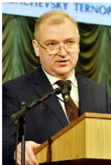
Заступник керівника головного департаменту з питань гуманітарної політики, керівник департаменту з питань охорони здоров'я та соціальної політики Адміністрації Президента України, професор Ігор ЛУРІН

опублікували понад 1000 наукових праць, понад 100 монографій і підручників. З нашого випуску також 7 кандидатів медичних наук, 15 головних лікарів, 8 заслужених лікарів України і один член Національної спілки