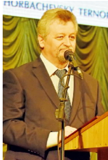
Президент НАМН України, академік, професор Віталій ЦИМБАЛЮК

Голова Тернопільської обласної державної адміністрації Степан Барна з нагоди 60-річчя уні-