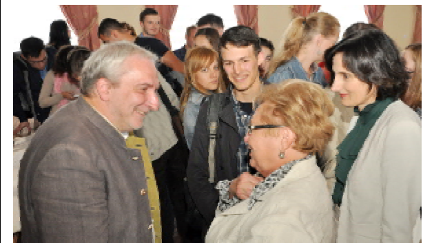
Професор Гаральд ТОЙСФЕЛЬБАУЕР серед студентів і викладачів ТДМУ

Цього ж дня актову залу ТДМУ була вщент заповнена студентами старших курсів, інтернами, викладачами хірургічних кафедр, науковими співробітниками, які прийшли послухати лекцію професора Гаральда Тойсфельбауера з актуальних питань судинної хірургії. Після лекції відбулося жваве обговорення із заявленої теми. Присутні отримали вичерпні відповіді на всі свої запитання.