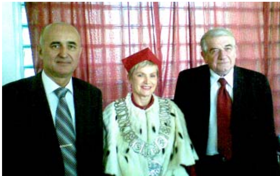
Ректор ТДМУ Леонід КОВАЛЬЧУК, ректор Шльонського медуніверситету Ева МАЛЕЦЬКА-ТЕНДЕРА, міністр охорони здоров'я Польщі п. РЕЛІГА

Теплота стосунків та приязне ставлення польських колег було відчутне вже з першої миті перебування у цьому ВНЗ. На святкуванні панувала атмосфера особливої урочистості: вчена рада — у мантиях університету, ректорів одинадцяти медичних університетів Польщі та керівників інших навчальних закладів регіону виріз-