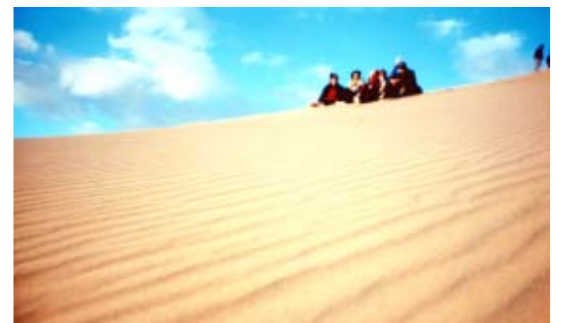
Така вона, пустеля Сахара