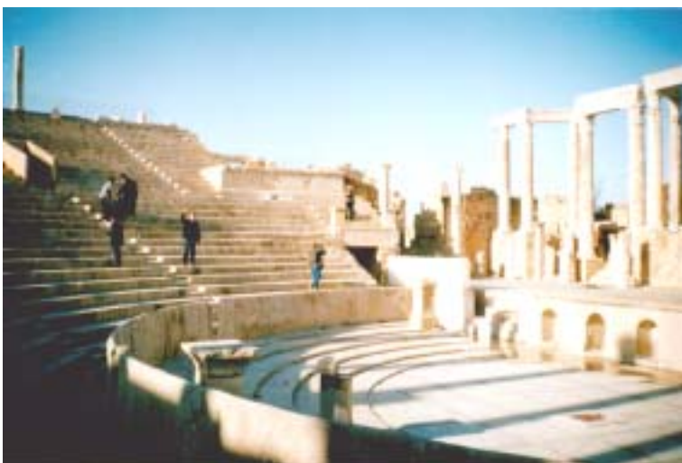
Руїни амфітеатру Римської імперії (I ст. до н.е.)

Багато наших медиків приїжджають цілими сім'ями, зі своїми дітьми, а між тим української школи тут і досі немає. От і змушені (як свого часу і я) оплачувати навчання в школі при посольстві Росії у Лівії, де понад 70 % учнів є українці.