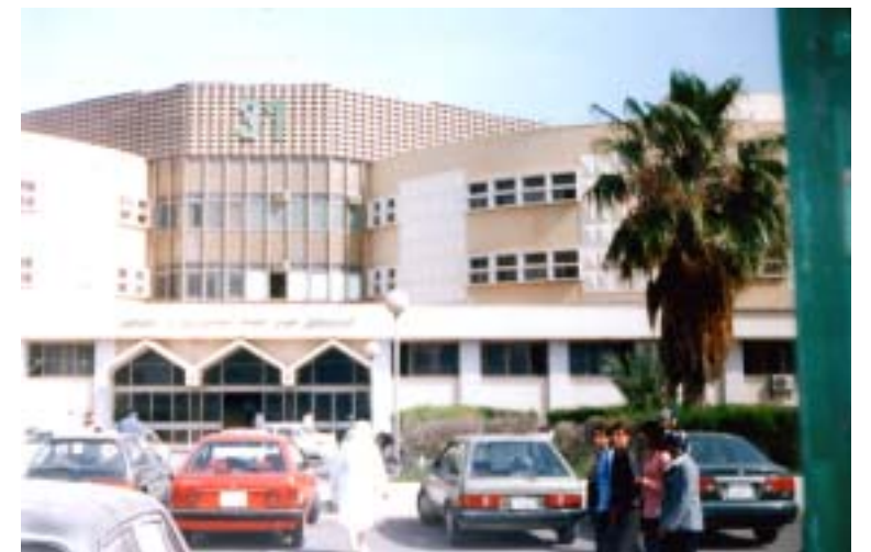
Центр опікової травми та пластичної хірургії м. Тріполі

Широким, у географічному розумінні, є тут і медичне представництво: Єгипет, Філіппіни, Індія, Північна Корея, Польща, Болгарія, Росія, Україна. Саме відсоток українських медиків тут є найвищим, і ця тенденція щороку підтверджується. В службі охорони здоров'я Лівії вигідно співіснують державна та приватна медицина, причому обох характеризує хороше матеріально-