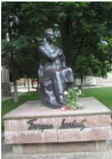
Пам'ятники Тарасові ШЕВЧЕНКУ та Богданові ЛЕПКОМУ в Бережанах