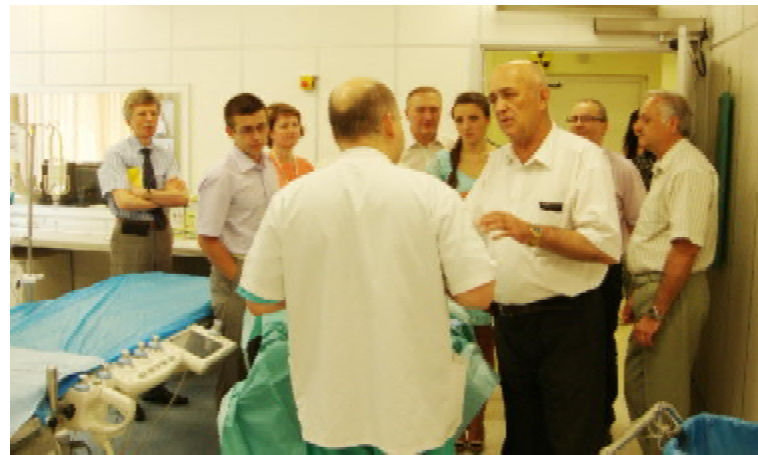
В операційній ендovasкулярної хірургії