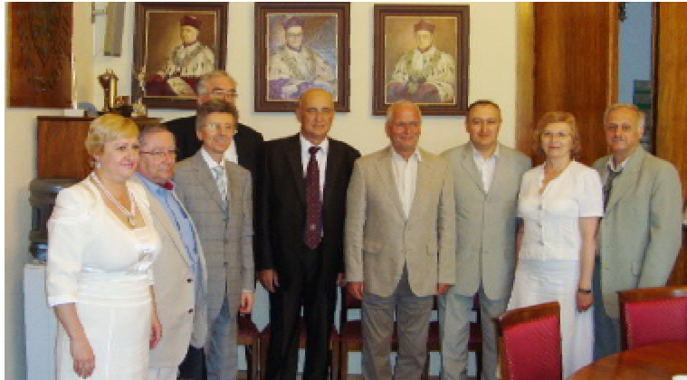
Українська делегація під час зустрічі з ректором Вроцлавського медуніверситету, проф. Марекком ЗЬОНТЕКОМ

У перший день візиту відбулася зустріч української делегації з ректором Вроцлавського медичного університету, професором Марекком Зьонтеком, який висловив слова щирої підтримки українському народові в розбудові сучасної європейської країни, зокрема, медичній спільноті у впровадженні світових стандартів підготовки лікарів. Він також звернув увагу на ті труднощі, з якими стикалися