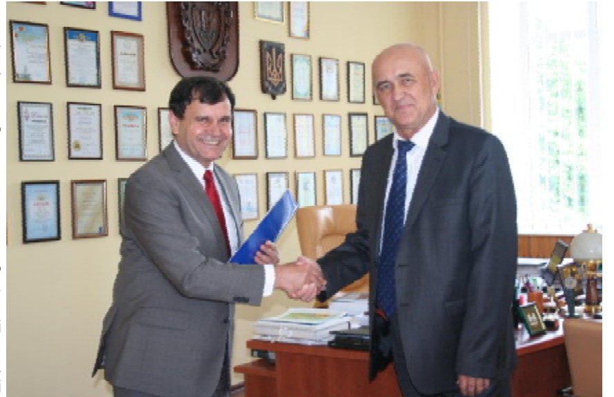
Ректор Вищої школи імені Папи Римського Іоанна-Павла II в Білій-Підлязці (Польща), професор Йозеф БЕРГЕР і ректор ТДМУ, член-кореспондент НАМН України, професор Леонід КОВАЛЬЧУК

взяти участь у двох наукових конференціях — «Сучасна людина в хворобі і здоров'ї» та «Фізична активність в стилі життя», які відбуваються щороку. Ректор ТДМУ запевнив, що тернопільські науковці-медики обов'язково братимуть у них участь.