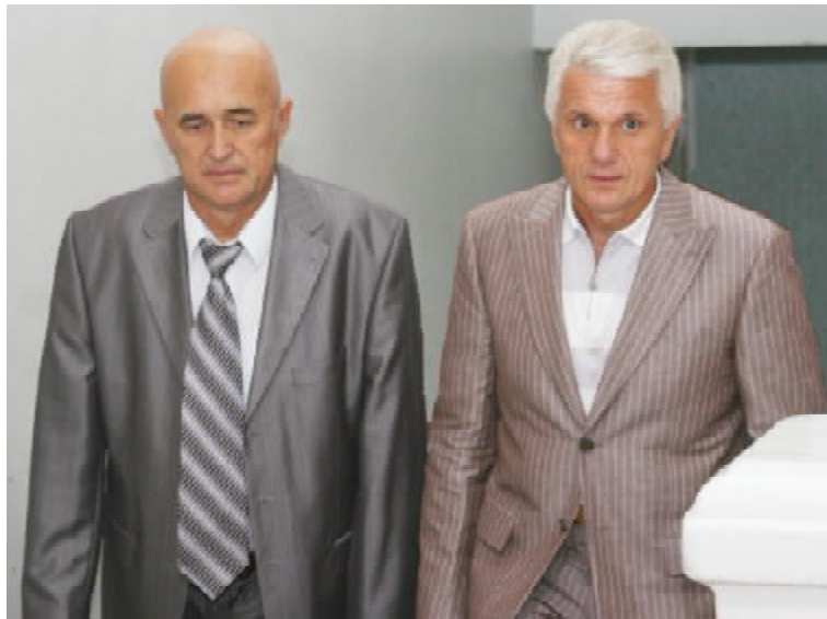
Ректор ТДМУ, член-кореспондент АМН України, професор Леонід КОВАЛЬЧУК ознайомлює з університетом Голову Верховної Ради України Володимира ЛИТВИНА

Володимир Литвин поінформував, що звернувся з листом до керівників обох палат російського парламенту з пропозицією невідкладно провести спільне засідання міжпарламентської комісії Україна-Росія з участю керівників обох законодавчих органів, щоб спокійно розглянути питання, які стали каменем спотикання. Зрозуміло, що пауза в українсько-російських відносинах не на користь ні Україні, ні Росії. Відсутність діалогу на найвищих рівнях призводить до загострення взаємних звинувачень. Крім того, не можна допустити, щоб статус України в світі понижувався, а відсутність послів Росії, США і виконання обов'язків тимчасово повіреними якраз і свідчить, що ми як держава у світовій спільноті починаємо втрачати свій статус. Голова Верховної Ради зазначив: українська влада не почуває себе легітимною (не формально, а по суті, за рівнем своєї підготовки). Причому на всіх рівнях. А відтак посадовці самоутверджуються на посаді не професійними діями (для цього в них не виста-