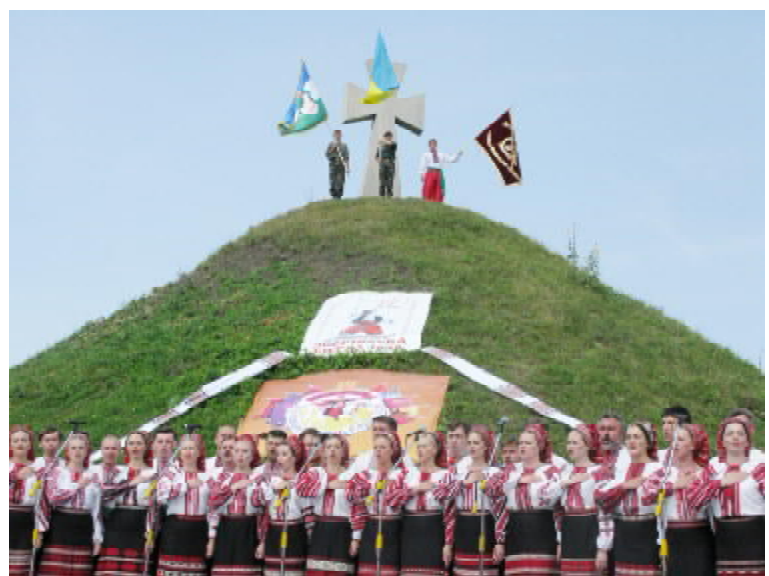
Біля великої козацької могили у Зборіві виступає Національний український народний хор ім. Григорія Верьовки

зацької держави. Юлія Тимошенко побажала бути справжніми патріотами, берегти пам'ять про величні сторінки літопису нашого народу, жити в мирі й злагоді та в історичному примиренні з народами-сусідами. Спікер українського парламенту Володимир Литвин вирішив взяти участь у цих урочистостях особисто. У своєму виступі він зауважив: «Коли будемо бачити нашу