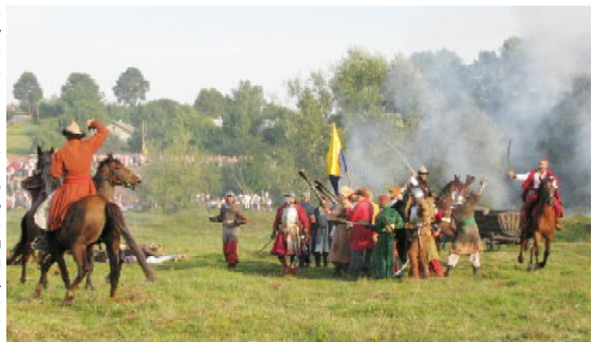
Фрагмент із Зборівської битви у відтворенні учасників військово-історичних клубів України, Польщі та Білорусі

читані також привітання від глав держави й уряду. Віктор Ющенко у своєму вітанні, зокрема, зазначив, що гетьман Богдан Хмельницький під Зборовом не лише здобув велику перемогу у визвольній війні, а й заклав підвалини української ко-