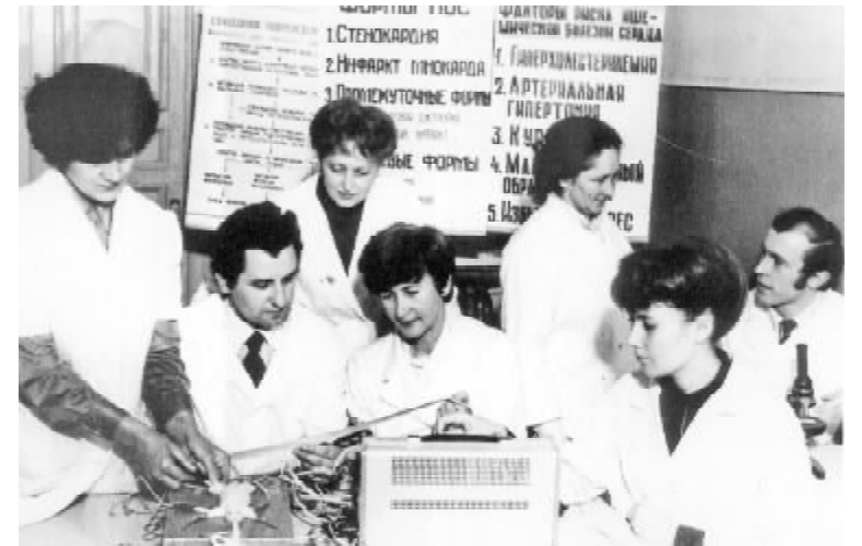
З колективом кафедри патологічної фізіології (1993 р.)

– З дитинства пізнав принагідність спелеології. Село Сивороги, що в Дунаєвецькому районі на Хмельниччині, де я народився та де промайнули мої дитячі роки, розташоване на мальовничих відрогах Подільської височини, густо порізаної долинами річок й ярами. Цей привабливий куточок здавна назива-