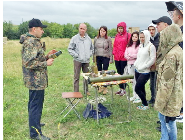
Вишкіл із розпізнавання вибухових пристроїв