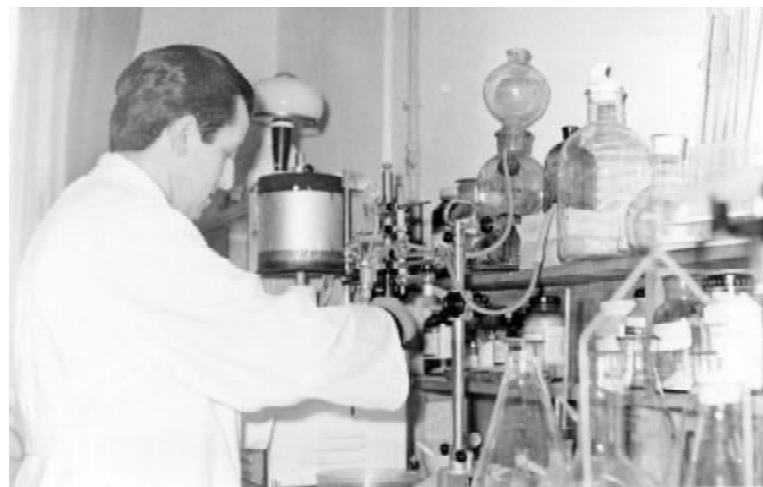
У науковій лабораторії кафедри. Визначення вмісту ацетилхоліну (1970 р.)

Наше навчання нестримно наближалось до завершення. Попереду чекали випускні державні іспити. Хоч ми й розуміли, що вони мають дещо формальний характер, але все-таки в нашій душі й душі мимоволі закрадалася легка тривога: чи зуміємо продемонструвати гідні знання, чи вдасться виправдати сподівання викладацького колективу. Хо-