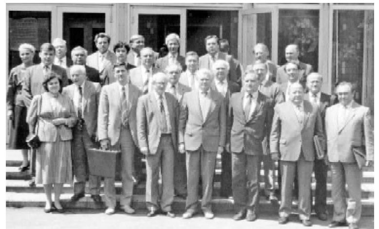
Серед учасників наради ректорів у Донецьку (22 травня 1990 р.)