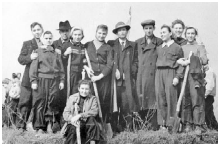
На посадці лісопарку за «Збаразьким поворотом» у Тернополі (осінь 1957 р.)