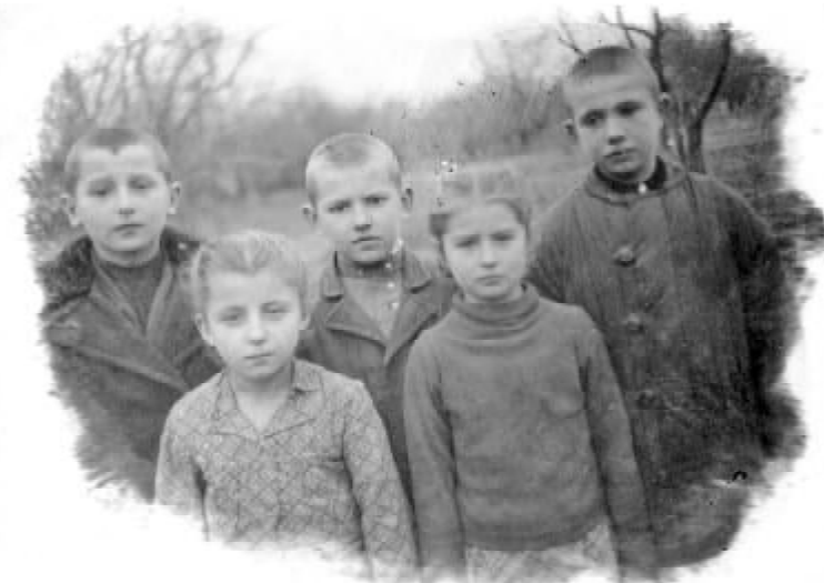
Кращі учні Сиворізької семирічки (1950-1951 навчальний рік)