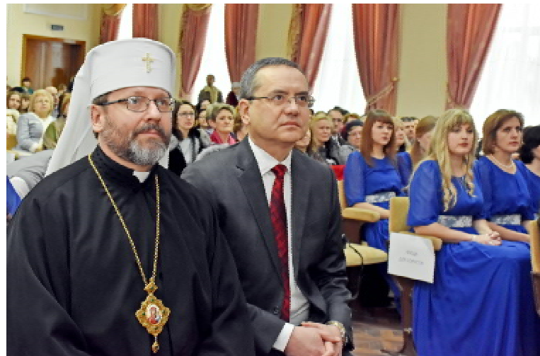
Патріарх УГКЦ Блаженніший Святослав ШЕВЧУК і ректор ТДМУ, професор Михайло КОРДА

«У нашому університеті сьогодні відбувається історична подія. Вперше ми приймаємо патріарха Української греко-католицької церкви Блаженнішого Святослава. Від всього колективу висловлюю щире подяку Вам за візит і духовну розмову, яка є важливою для кожного з нас. Вас прийшли послухати як викладачі університету, так практикуючі лікарі та студенти. Ми лікуємо фізично, але добре знаємо, що неможливо вилікувати тіло, якщо не вилікувати душу. Саме тому професія лікаря та професія священника взаємодоповнюють одна одну. У цьому розумінні велике значення має виховання духовності у майбутніх лікарів. У нашому університеті з цією метою започатко-