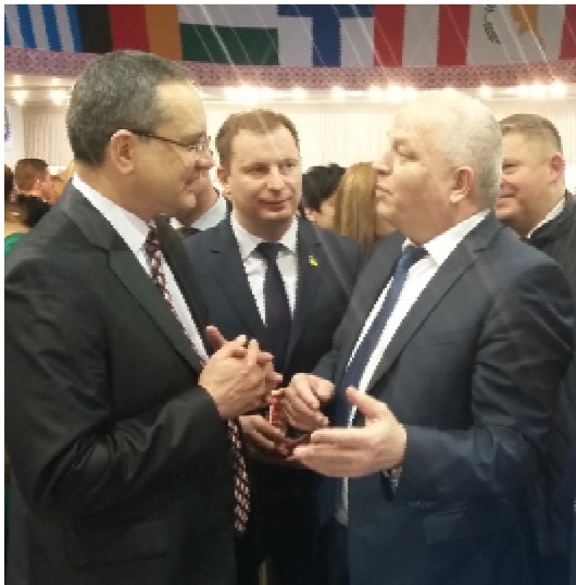
(Зліва направо): Михайло КОРДА , ректор ТДМУ, професор, Степан БАРНА , голова Тернопільської облдержадміністрації, Степан КУБІВ , перший віце-прем'єр-міністр України

тальніше ознайомилися з діяльністю нашого вишу.