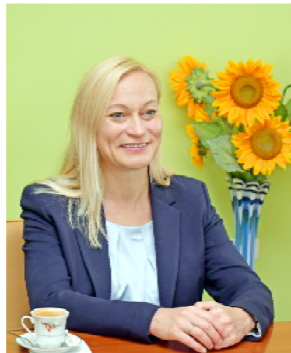
Професорка Крістін РАДКЕ (Австрія)

го вишу й ми обговорили певне коло питань. А тепер, коли я побувала у вас, то переконалася, що в нас гарні перспективи для співпраці як у науковій, так і в лікувальній царині. У мене чималий досвід у пластичній реконструктивній хірургії, в університетській клініці Віденського університету виконуємо доволі широкий спектр хірургічних втручань. Зокрема, я очолюю відділення, де проводять реконструктивні та естетичні операції в пацієнтів з паралічем лицевого нерва, рекон-