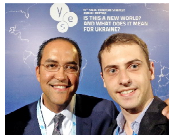
(Зліва направо): Вільям ГЬОРД – конгресмен (США), Петро ТАБАС – студент ТДМУ

гу приділяли також медичним та екологічним проблемам, зокрема, Джон Кері наголосив, що боротьба з глобальним потеплінням є одним з завдань найближчого майбутнього. Багато спікерів, серед яких сенатор Вільям Гьорд, генерал Кіт Александер та колишній міністр оборони США Роберт Гейтс висловлювали стурбованість питаннями кібербезпеки, адже кібератаки становлять значну небезпеку вже зараз і потенційно стануть головним питанням безпеки у майбутньому.